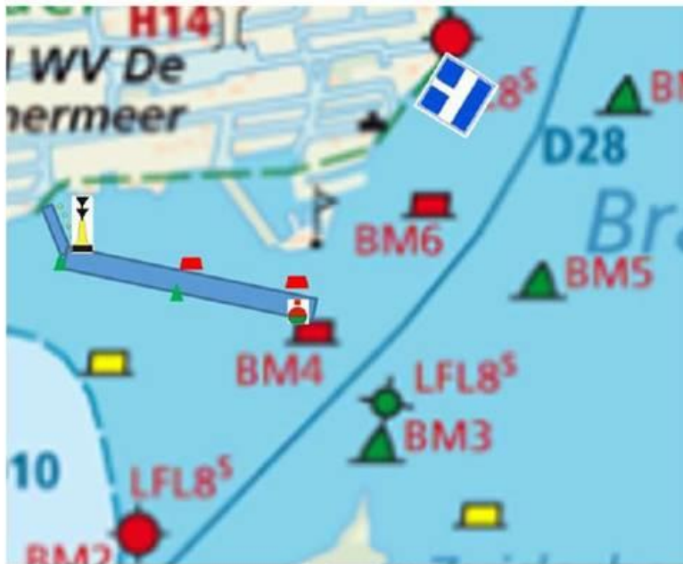
Figuur 6 Geplande geul met betonning en E9.c. bord

Voor de werkzaamheden aan “De Poelen” is een vaarwegbetonning aangebracht.